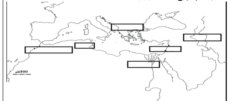
خريطة حضارات البحر الابيض المتوسط