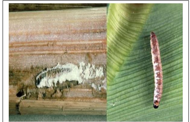
Document2 : Croissance du mycélium de Beauveria bassiana sur les larves de la pyrale du maïs