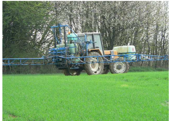
L'agriculteur répand des engrais dans le sol de la culture