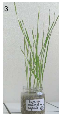
Milieu 3 : eau du robinet + sels minéraux (engrais liquide)