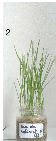
Milieu 2 : eau du robinet