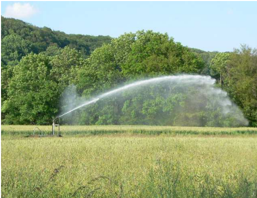
Arrosage d'un champ de maïs en été