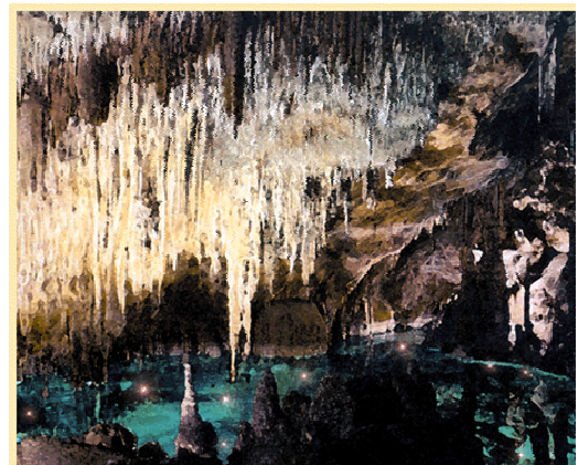
Aucun végétal chlorophyllien ne pousse dans cette grotte qu'éclaire le flash du photographe