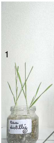
Milieu 1 : eau distillée