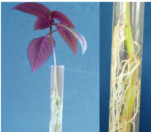
Culture sur solution liquide contenant de l'eau et des sels minéraux (= engrais)