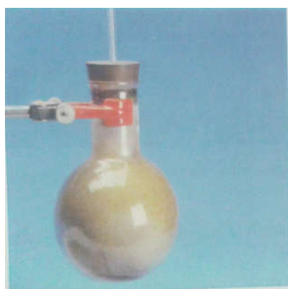
Fig. 2. Réaction entre le dichlore et l'aluminium. Le ballon contient du dichlore (gaz) et de l'aluminium en poudre. Quand on chauffe, l'aluminium réagit vivement avec le dichlore. On obtient du trichlorure d'aluminium AlCl_3