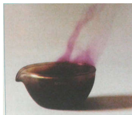
Fig. 4. Réaction entre le diiode et l'aluminium. On mélange du diiode I_2 (pilé dans un mortier) et de l'aluminium en poudre. La réaction se déclenche quand on ajoute quelques gouttes d'eau (catalyseur) ; elle forme du triiodure d'aluminium AlI_3 . Le dégagement de chaleur provoque l'apparition d'un nuage violet de diiode.