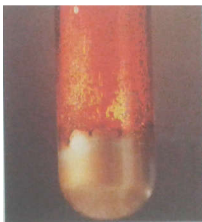
Fig. 3. Réaction entre le dibrome et l'aluminium. On laisse tomber quelques gouttes de dibrome liquide Br_2 sur de l'aluminium en poudre ; on observe alors de vives incandescences. Il y a formation de tribromure d'aluminium AlBr_3