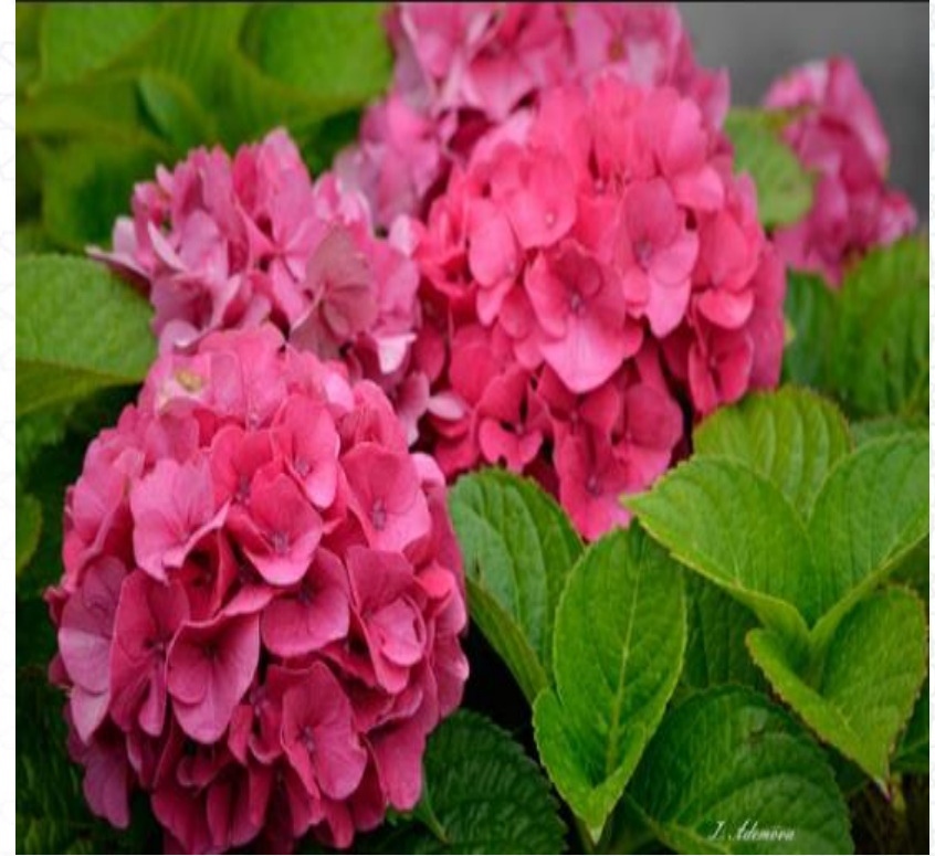
زهرة الأرتنسية في تربة حمضية