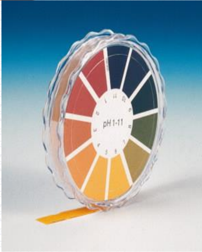
علبة ورق pH