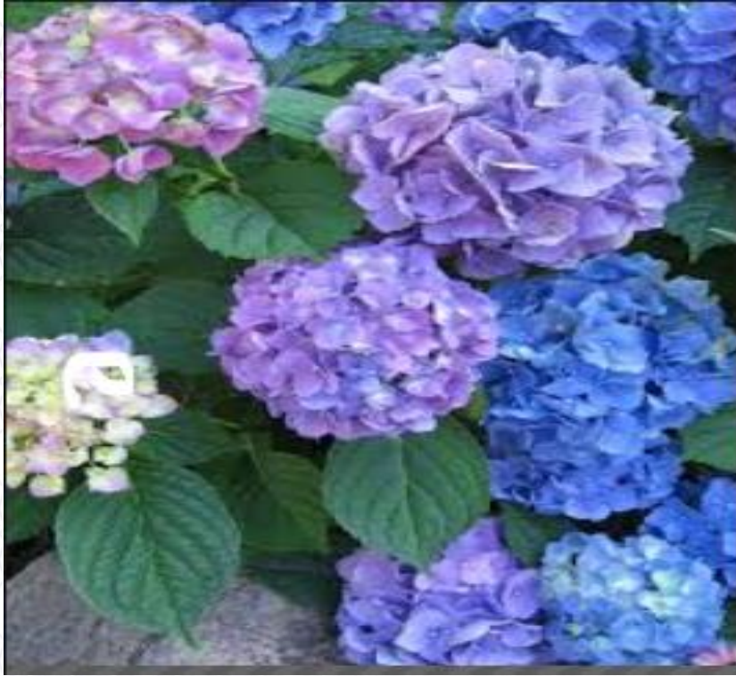
زهرة الأرتنسية في تربة قاعدية.