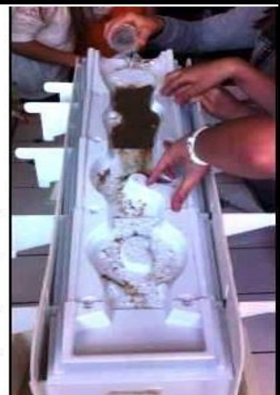
Document 11 : Les Facteurs contrôlant le transport des sédiments