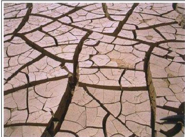
b) Fente de dessiccation actuelles