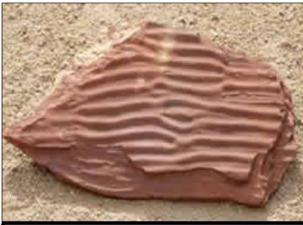
a) Rides anciennes