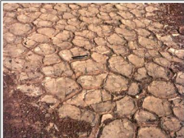
a) Fente de dessiccation anciennes (-180MA)

Document 9: Exemples de figures sédimentaires dépendes dynamisme du transport