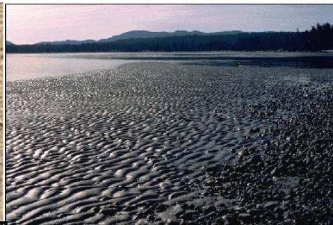
b) Rides actuelles