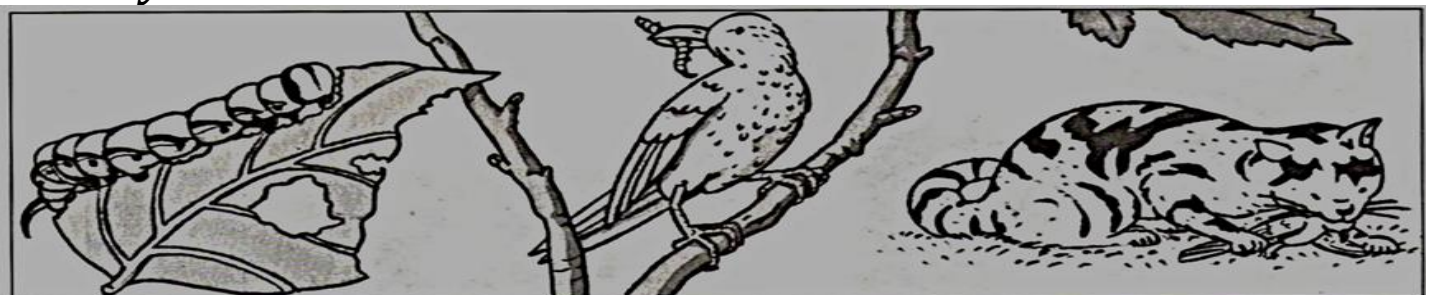
Une chenille mange une feuille.

Le document ci-dessous représente une relation entre les êtres vivant dans un écosystème.