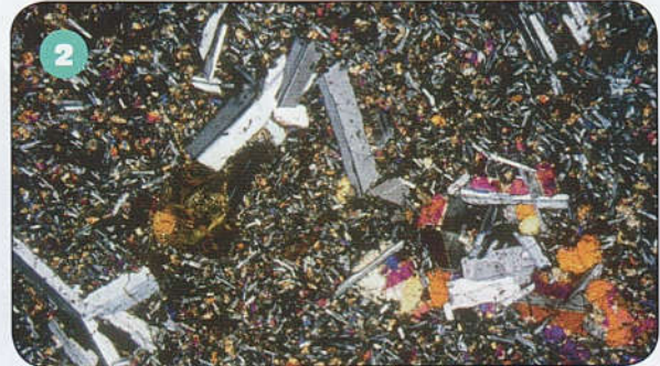
DOC 2 : Lame mince du basalte observée au microscope en lumière polarisée