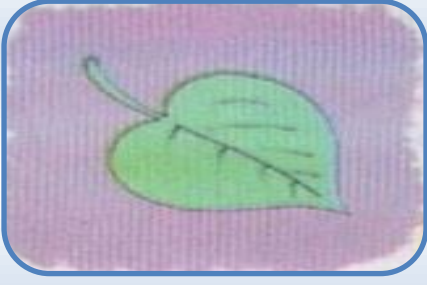
ورقة على شكل رمح